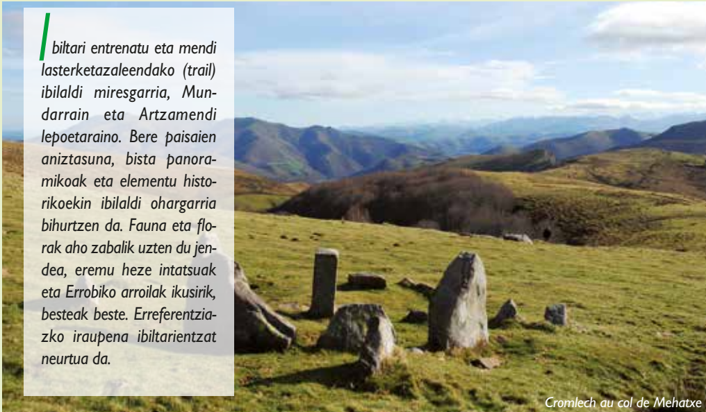
Cromlech au col de Mehatxe

bitari entrenatu eta mendi lasterketazaleendako (trail) ibilaldi miresgarria, Mundarrain eta Artzamendi lepoetaraino. Bere paisaien aniztasuna, bista panoramikoak eta elementu historikoekin ibilaldi ohargarria bihurtzen da. Fauna eta flora aho zabalik uzten du jendea, eremu heze intatsuak eta Errobiko arroilak ikusirik, besteak beste. Erreferentziak zko iraupena ibiltarientzat neurtua da.